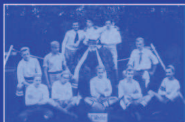
BSG Motor Nordhausen West FUSSBALL - DDR - LIGA - Kollektiv 1970/71