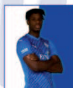
BIAI DECO 17.05.2000